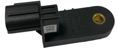
刹车主缸位移传感器 Hall Displacement Sensor

The Hall voltage output is determined only by its displacement in the magnetic field. The data measured by Hall sensor can be processed by a computer to display the measured data directly or to be used by various control systems.